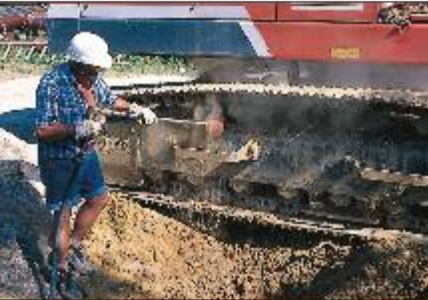
Reinigen von Baumaschinen