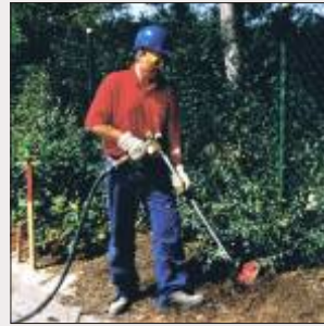
Belüften von Wurzelwerk