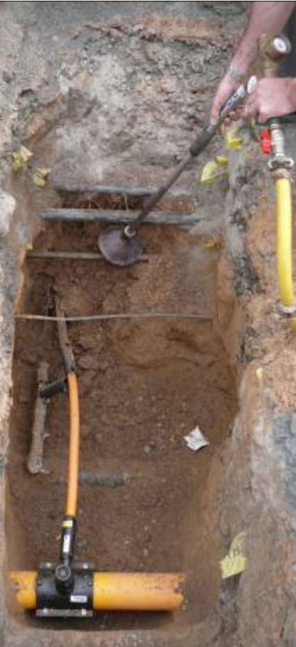
Untermunieren für Anschlussarbeiten