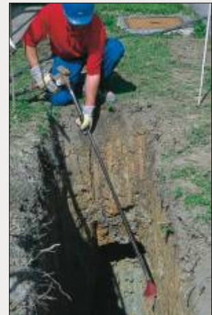
Arbeiten mit Verlängerungsrohr